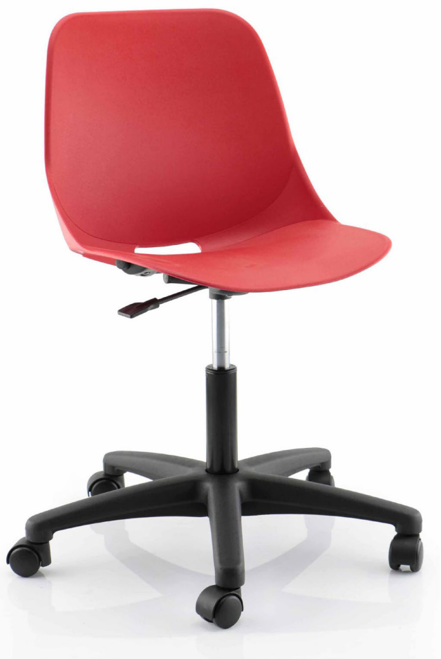
KA04/16 (coloris Rouge)

Les numéros indiqués pour chaque coloris font référence à des RAL approximatifs, sauf ceux indiqués en Pantone. Photos coloris non contractuelles. Se référer au nuancier réel.